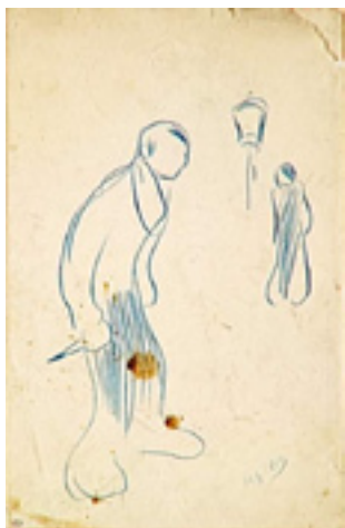
Silhouettes feminine et masculine