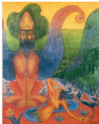
Hippogriffe, 1891, Paul-Élie Ranson