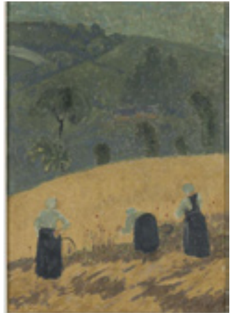
La Moisson de Paul Sérusier

Il enseigna régulièrement à l’Académie Ranson à partir de 1908. En 1921 il publia ABC de la peinture, un court traité dans lequel il développait une théorie des courbes et des formes simples, une théorie des couleurs et une méthode de recherche des couleurs sourdes. Il s’agit du mémoire de toutes ses recherches esthétiques. Sérusier s’éteint en 1927 à Morlaix.