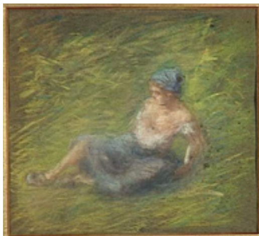
Paysanne couchée Ibels Henri-Gabriel 20 siècle