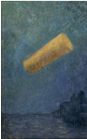
Cylindre d'or Paul Sérusier 1910

paraphées du sigle « ETPMVMP » En ta paume mon verbe et ma pensée. Ses études tardives sur l’art égyptien, les primitifs italiens et les tapisseries du Moyen Âge le menèrent à des œuvres décoratives, mesurées d’une certaine façon «hors du temps».